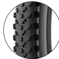
RENNEN GEMISCHT/ FORTGESCHRITTENE